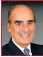
Guillermo Alberto Francos (Argentina)